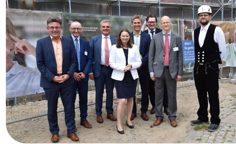
Gruppenbild mit Gesundheitsministerin Dr. Melanie Leonhard

Die Behörde fördert den Bau mit mehr als 34 Millionen Euro, die Immanuel Albertinen Diakonie beteiligt sich mit weiteren 18,9 Millionen Euro an den Baukosten.