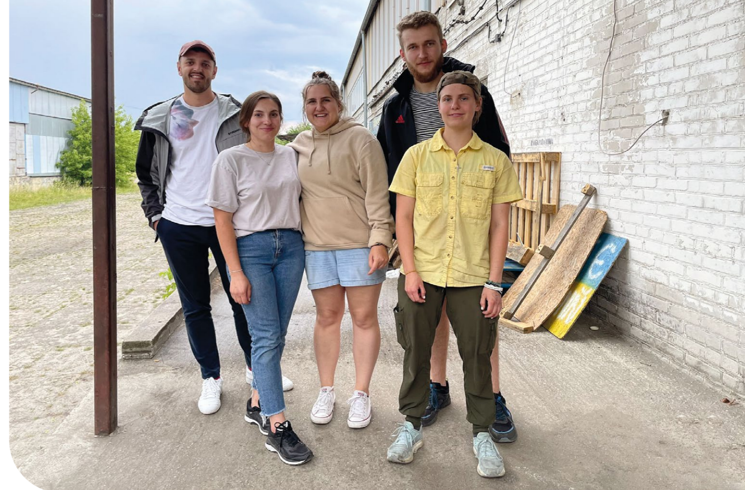
Ein Zeichen der Hoffnung – das Team vor Ort im polnischen Chełm