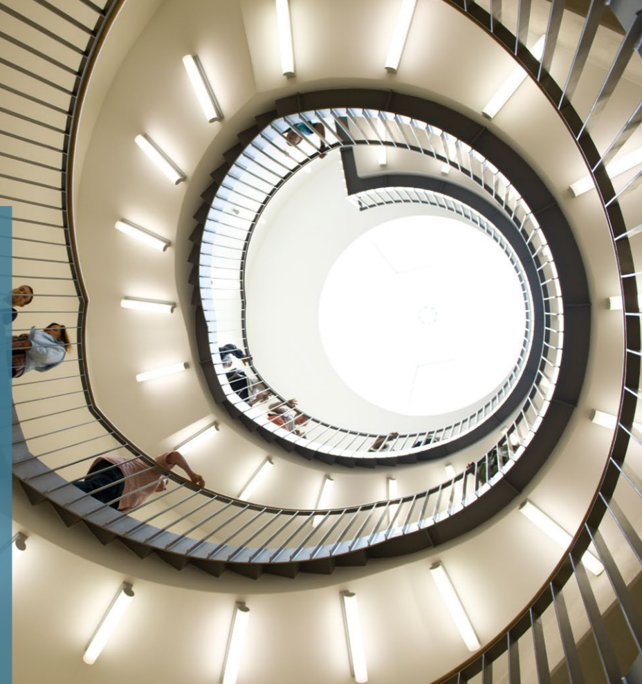
Einsatz von energiesparenden Leuchtmitteln in der Immanuel Klinik Rüdersdorf