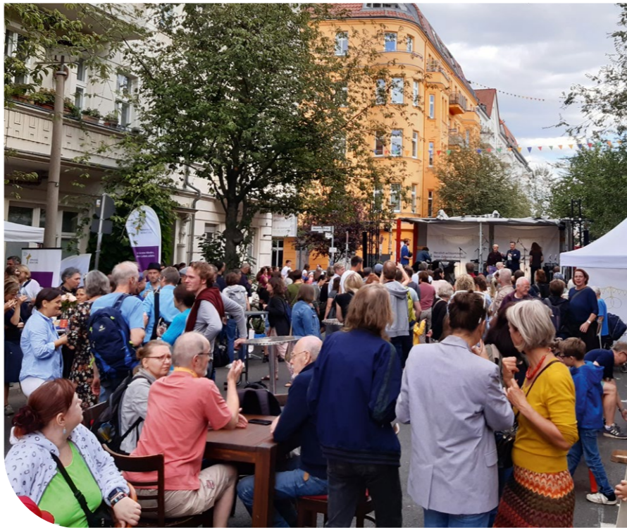
Fördert Nachbarschaft und Solidarität: das Zelterstraßenfest am 3. September zugunsten obdach- und wohnungsloser Menschen