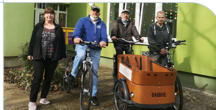
Die Hausmeisterflotte fährt Rad

Der heilpädagogische Förderbereich der Behindertenhilfe in der Immanuel Diakonie Südthüringen erhält ab 2024 einen Neubau. Auf einer Grundfläche von 850 Quadratmeter entsteht neben dem Immanuel Therapiezentrum Eichenrain ein eingeschossiges Gebäude. Die Heilpädagogische Förderung ist eine tagesstrukturierende Maßnahme für Menschen mit Behinderung im arbeitsfähigen Alter, die nicht, noch nicht oder nicht mehr in eine Werkstatt für Menschen mit Behinderung eingegliedert werden können. Für den Bau sind Investitionen von rund 3,4 Millionen Euro vorgesehen.