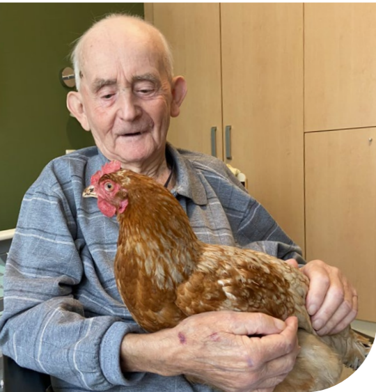
Glücksmomente schenken Hoffnung, hier im Diakonie Hospiz Woltersdorf

Tatsächlich erlebt das Hospizteam Hoffnung auf allen Ebenen des Lebens – auf der körperlichen, psychischen und spirituellen Ebene