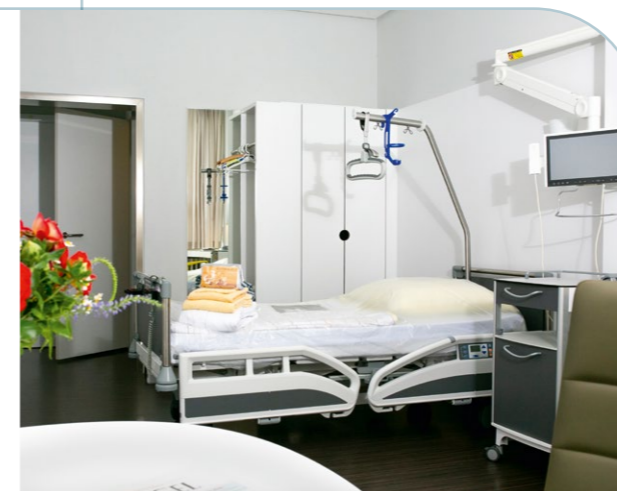
Eines der neuen Patientenzimmer

Bettenhauses betragen knapp 11 Millionen Euro, finanziert aus pauschalen Fördermitteln des Landes Berlin. Anlässlich der Fertigstellung lobte Gesundheitsministerin Ulrike Gode den Beitrag zur Modernisierung der Berliner Krankenhausversorgung. Die Ministerin unterstrich, wie wichtig die Pluralität öffentlicher, privater und freigemeinnütziger Träger für Berlin sei.