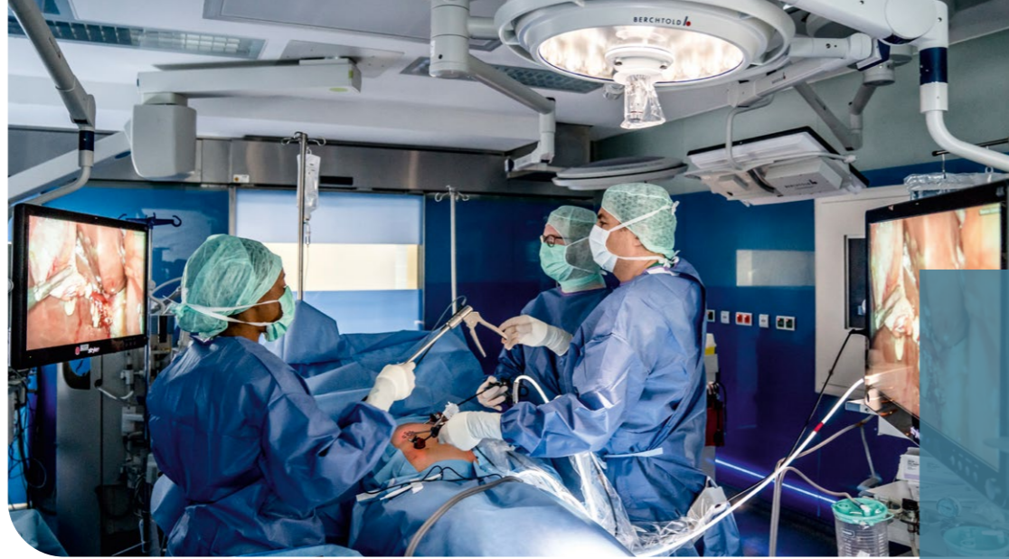
Operation im Evangelischen Amalie Sieveking Krankenhaus