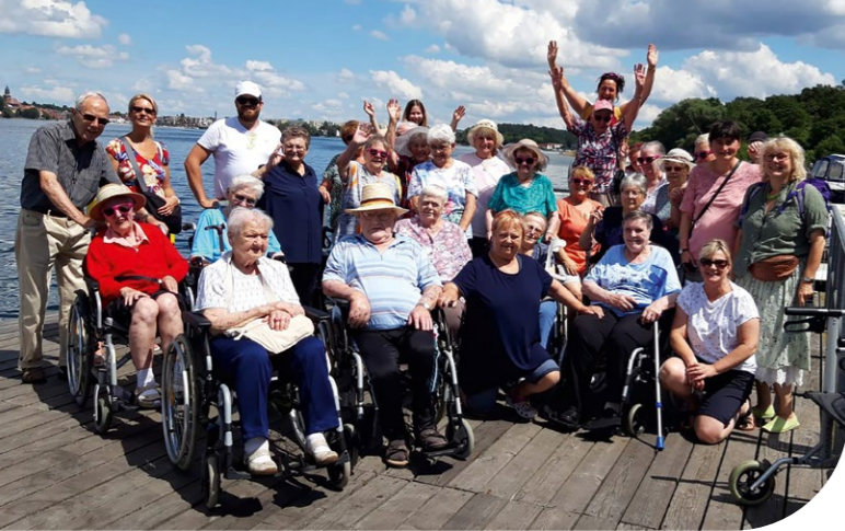
Lebensfreude pur in Waren an der Müritz: Eine Reisegruppe der Brandenburger Pflegeeinrichtungen Immanuel Haus am Kalksee (Rüdersdorf) und Immanuel Seniorenzentrum Kläre Weist (Petershagen) fuhr für fünf Tage ins Gästehaus der Schwesterneinrichtung Immanuel Haus Ecktannen und erlebte ein vielfältiges Programm aus Natur und Kultur