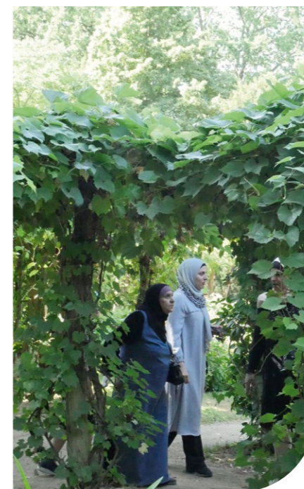
Beim gemeinsamen Ausflug des Frauencafés auf die Berliner Pfaueninsel

Seit sechs Jahren treffen sich einmal in der Woche Frauen aus Syrien, Afghanistan, Irak, Äthiopien und anderen Ländern im Frauencafé des Immanuel Beratungszentrums Marzahn. Die Atmosphäre ist freundlich und einladend, jede ist willkommen. Eine feste Agenda hat das Treffen nicht. Es geht den Frauen hier vor allem darum, Anschluss zu finden und einen Raum zu haben, um über Erlebtes wie über aktuelle Erfahrungen zu sprechen. Manche Themen kommen häufiger zur Sprache und werden mit den Beraterinnen und den ehrenamtlichen Helferinnen diskutiert: Kindererziehung und Bildung, Sexualität, Partnerschaft und Verhütung, aber auch der Umgang mit verschiedenen Formen der Gewalt – innerhalb von Partnerschaften und Familien wie auch im öffentlichen Raum. In einem anderen Projekt des Beratungszentrums schreiben und