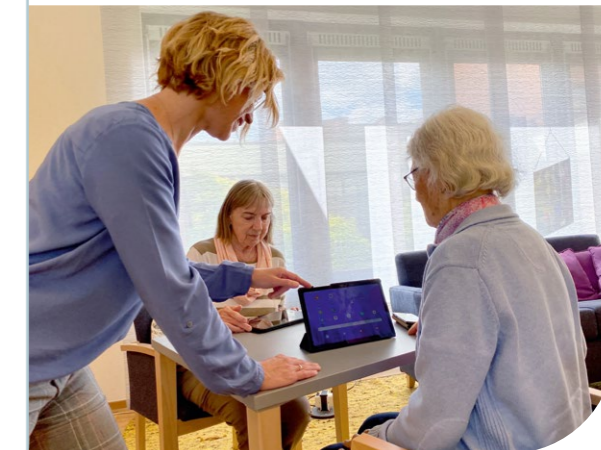
Gut angeleitet unterwegs in der digitalen Welt

Beratung + Leben hat dieses Jahr die drei Standorte des früheren Diakonischen Werks Reinickendorf übernommen und vor der Schließung gerettet. Zum Angebot von Immanuel Beratung Reinickendorf gehören Sozialberatung, Schulsozialarbeit, Schwangerenberatung, Familien- und Erziehungsberatung, Familienlotsinnen und Familienpatenschaftsprojekte. Zudem gibt es ein Projekt zur Integration Geflüchteter, einen Hausmeisterservice, in dem ehemals Langzeitarbeitslose haushaltsnahe Dienste anbieten, eine Begegnungsstätte für ältere Menschen und zwei Haltestellen für Menschen mit Demenz und deren pflegende Angehörige. Beratung + Leben begleitet jetzt Menschen an 25 Standorten in Berlin und Brandenburg.